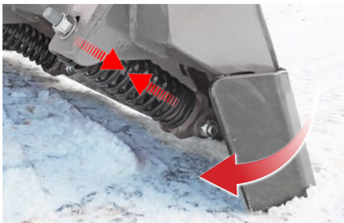
Rezná hrana so zarážkovými (trip) pružinami