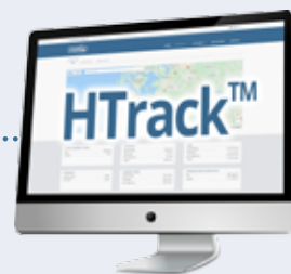
Voliteľný program HTrack™ prenáša údaje o rozmetávaní prostredníctvom mobilnej siete