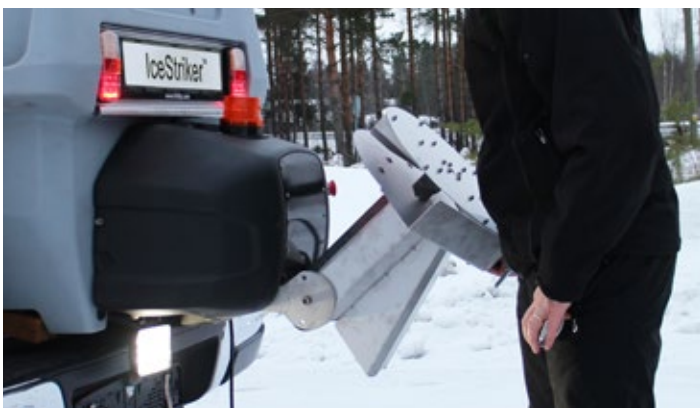
Sklopný žlab z nehrdzavejúcej ocele určený na rozmetávanie soli s vysokou vlhkosťou