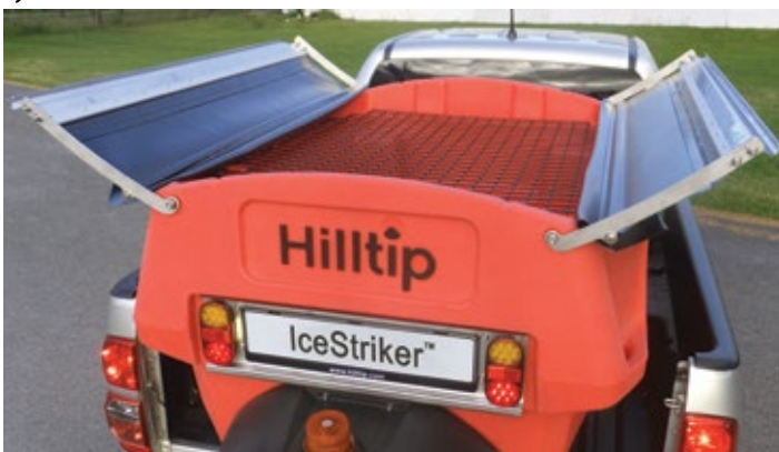
Dvojkusový plachtový mechanizmus a horná sieťka