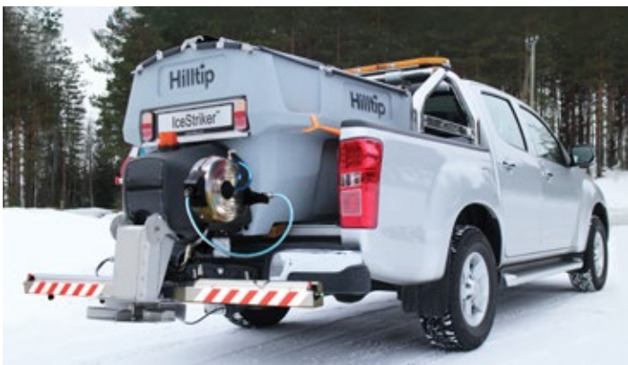
Voliteľná rozprašovacia lišta a hadicový navijak